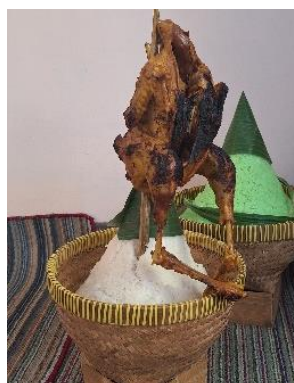
Gambar 10. Tumpeng Panggang (Ingkung)

Dalam tumpeng, umumnya disertai dengan makanan pelengkap lainnya. Hal ini pula yang diterapkan masyarakat Dataran Tinggi Dieng pada tradisi Baritan yang dilaksanakan. Akan tetapi, keunikan tampak pada pelengkap yang digunakan. Pada gambar 9 dan gambar 10 , pelengkap berupa apem dan ayam ingkung. Tidak seperti di tempat lain yang umumnya menggunakan makanan pelengkap berupa sayuran atau urap dan sebagainya.