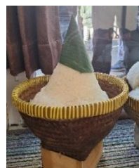
Gambar 3. Tumpeng Putih