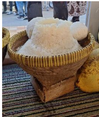
Gambar 7. Tumpeng Golong

Penggunaan tumpeng oleh masyarakat Dataran Tinggi Dieng dalam tradisi Baritan yang digelar juga menggunakan bentuk dan pelengkap tertentu. Masyarakat membentuk tumpeng dengan berbagai bentuk dan juga menjadi simbol dengan makna yang beragam. Hal ini menjadikan makanan syarat akan simbol dan makna filosofis pada ritual yang digelar.