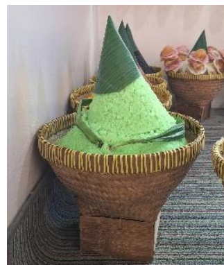
Gambar 6. Tumpeng Ijo ( Tumpeng Hijau )

Keunikan dalam tradisi Baritan di Dataran Tinggi Dieng adalah penggunaan tumpeng dengan warna merah, hitam, dan hijau. Masyarakat menamai berdasarkan nama tetapi disebut dalam bahasa Jawa yakni abang , ireng , dan ijo . Tumpeng dengan warna ini jarang dijumpai di tempat lain sehingga tidak sepopuler tumpeng kuning dan tumpeng putih . Warna ini adalah variasi yang dibuat oleh masyarakat Dataran Tinggi Dieng dengan tiap-tiap filosofi yang melingkupi.