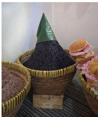
Gambar 5. Tumpeng Ireng ( Tumpeng Hitam )