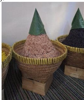
Gambar 4. Tumpeng Abang ( Tumpeng Merah )

Dalam kebudayaan Kebo-keboan di Banyuwangi, tumpeng kuning dan tumpeng putih menyimbolkan puncak tertinggi kehidupan yakni menggambarkan hubungan manusia dengan Tuhan dengan harapan lebih mendekatkan diri dan menyerahkan hidup pada Sang Pencipta alam semesta (Pribadi et al., 2021). Masyarakat Baduy Luar, Banten, menggunakan tumpeng, secara spesifik disebut congcot , dalam berbagai ritual seperti halnya dalam ritual kelahiran hingga kematian yang merupakan penggambaran ungkapan rasa syukur dan simbol khidmat pada Sang Pencipta (Krisnadi et al., 2024). Makna filosofis tumpeng merupakan wujud rasa syukur, kerukunan dan kebersamaan yang digunakan sebagai sarana ungkapan rasa syukur kepada Tuhan dan menyatukan masyarakat yang juga merepresentasikan kesejahteraan masyarakat karena dibuat dari beras dan bersumber dari padi yang ditanam di alam sekitar (Surya et al., 2025).