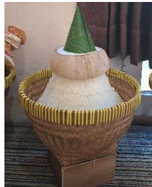
Gambar 8. Tumpeng Kalung

Bentuk variasi yang dibuat meliputi tumpeng golong dan tumpeng kalung yang merepresentasikan aktualisasi nilai Islam dan menggambarkan persaudaraan dan harapan untuk menghindari hal buruk. Tumpeng golong yang dikepalkan membentuk bulatan menggambarkan bahwa setiap manusia harus membaur dengan masyarakat dan hidup berdampingan dengan sesama. Sementara tumpeng kalung menandakan upaya mengikat hal buruk pada diri manusia atau hal yang kurang baik pada diri seseorang sehingga perlu untuk diredam, salah satunya adalah hawa nafsu.