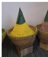
Gambar 2. Tumpeng Kuning

Tradisi Baritan yang dilaksanakan di Dataran Tinggi Dieng, Jawa Tengah memiliki ciri khas unik yang membedakan dengan tradisi Baritan di tempat lain yakni variasi ragam tumpeng yang beraneka warna. Hal ini bukan semata dibuat begitu saja, tetapi memiliki makna tertentu dan merepresentasikan harapan masyarakat yang terlibat dalam tradisi tersebut. Masyarakat secara harfiah menyebut nama tumpeng sesuai dengan warna yang ada sehingga membentuk suatu nama Tumpeng + Warna . Ada pun keseluruhan makna dipaparkan secara mendalam dalam analisis penelitian berikut.