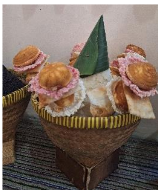
Gambar 9. Tumpeng Robyong

Hampir dalam semua tradisi adat yang menggunakan makanan di Surakarta, Jawa Tengah selalu menggunakan nasi tumpeng sebagai bagian utamanya dan dilengkapi dengan beragam hasil bumi khususnya tumbuhan, mulai dari daun, buah, bunga, batang, hingga biji (Mukarromah et al., 2024). Tumpeng digunakan dalam berbagai tradisi karena menjaga hubungan manusia dengan Tuhan dan mendorong budaya lokal yang berakar pada tradisi keanekaragaman hayati yang ada di sekitar (Candraningtyas et al., 2025). Hal ini menguatkan bahwa makanan yang digunakan dalam tradisi ritual tertentu memuat makna filosofi yang ditanamkan oleh masyarakat dan dapat dimaknai secara harfiah.