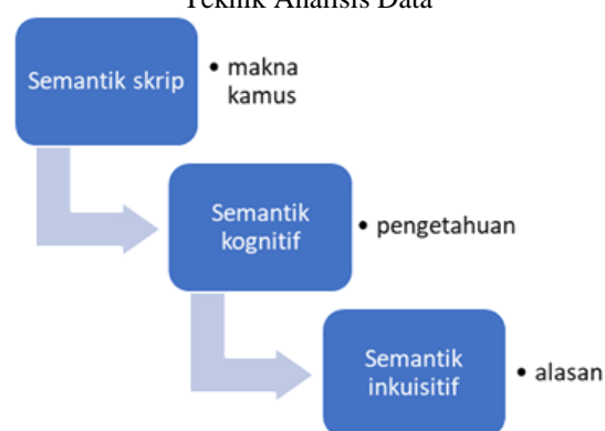
Bagan 2. Teknik Analisis Data

Teknik analisis data pada penelitian ini menggunakan tiga tahap analisis yaitu semantik skrip, semantik kognitif, dan semantik inkuisitif yang merujuk pada data temuan yaitu motif itik pulang patang pada rumah adat Minang.