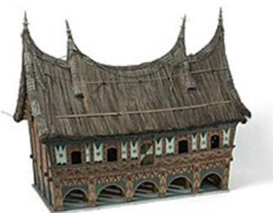
Gambar 4. Rumah gadang bodi caniago

Rumah gadang bukan rumah yang di bangun menggunakan fondasi batu ataupun campuran semen. Rumah ini dibangun di atas tiang-tiang yang disusun sedikit miring dengan bertumpu pada sebuah batu sebagai landasannya. Tujuan desain rumah ini menggunakan teknik panggung adalah karena Sumatra Barat adalah salah satu