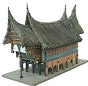
Gambar 3. Rumah gadang piliang

Walaupun memiliki bentuk yang berbeda, kedua rumah gadang ini sama-sama menggunakan atap yang melengkung dan lancip ke atas, dinding rumah yang berbentuk trapesium, dan berbentuk rumah panggung. Bagi masyarakat Minang, rumah adat ini bukan sekadar rumah sebagai tempat untuk berlindung dari panasnya matahari dan derasnya hujan. Rumah ini merupakan suatu lambang eksistensi yang menunjukkan keberadaan masyarakat suatu kaum dari suku-suku mereka di bawah satu payung adat yang dipimpin oleh seorang penghulu (Marthala, 2013:12). Anjungan pada rumah gadang piliang dan bodi caniago dapat dilihat pada gambar di bawah ini.