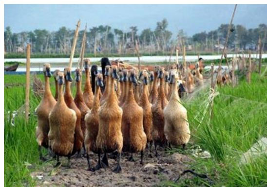
Gambar 2. Itik yang bergerombol

an manusia sehingga dipilih sebagai salah satu motif ukiran rumah gadang yang fenomenal. Pertama, itik adalah hewan yang setia dan juga kompak dalam kebersamaan. Hal ini dapat kita lihat melalui kehidupan sehari-hari, baik itu itik liar maupun ternak, tidak ada satu pun itik yang hidup menyendiri ataupun pergi berjalan sendiri. Jika ia terpisah dari gerombolan, maka ia akan terus mencari untuk bisa bergabung dan juga bersama lagi. Sikap seperti inilah yang dijadikan oleh masyarakat Minang sebagai suatu contoh untuk diterapkan dalam kehidupan sehari-hari. Para datuk atau penghulu kaum tidak memilih sesuatu hal berdasarkan keinginan atau keindahan saja, melainkan nilai-nilai dan juga makna filosofinya menjadi bagian yang terpenting karena itu adalah gambaran jati diri masyarakat Minang.