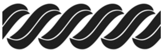
Gambar 1. Motif Itik Pulang Patang